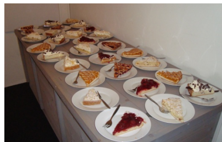
Wordt dit straks weer gewoon in De Bilt?

Werkgroep website en genealogie: Raoul Laboyrie